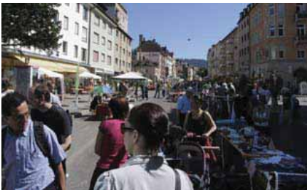
Sommerfest 2009; Flohmarkt auf der Habs Archiv: Schaps Werbekonzepte Freiburg

Die 1,6 km lange Habsburgerstraße dient als Hauptverkehrsachse zwischen der Freiburger Innenstadt und den nördlich angrenzenden Stadtteilen Herdern und Zähringen. Zudem hat sie regional wichtige Erschließungsfunktionen für das nördliche Freiburger Umland. Entlang dieses Abschnitts befinden sich ca. 130 Gewerbetreibende aus den Branchen Einzelhandel, Gastronomie und Dienstleistung in mehr oder weniger dichter Folge. Der marode Zustand von Kanalisation und Straßenbahngleisen machte eine vollständige Tiefbausanierung der Habsburgerstraße erforderlich. Diese mehr als zwei Jahre währende Baumaßnahme wurde ferner zum Anlass genommen, den Straßenzug auf ganzer Breite von Hauskante zu Hauskante städtebaulich aufzuwerten und Verkehrlich zu beruhigen.