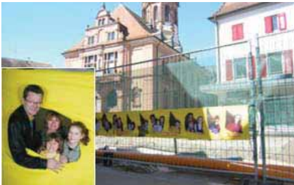
Fotoaktion „Zaungäste“ als Bauzaungestaltung

Die Innenstadtgemeinschaft Bühl InAktion e.V. war für das Baustellenrahmenprogramm verantwortlich. Insgesamt wurden über vier Jahre hinweg rund 100.000 € für vielfältigste Marketingaktivitäten ausgegeben. Zum Markenzeichen des Bühler Baustellenmarketings entwickelte sich ein 1,5 m breiter „Blauer Teppich“ aus Kunstrasen, der in den jeweiligen Bauabschnitten für einen sicheren Tritt sorgte und den Passanten anzeigte, wo sie die Baustelle queren bzw. wie sie zu den Geschäften gelangen konnten.