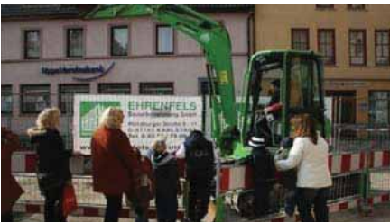
Baggern für Kinder, Karlstadt