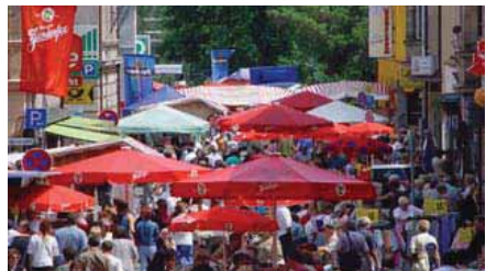
Baustellenfest, Zirndorf Foto: CIMA GmbH, 2006