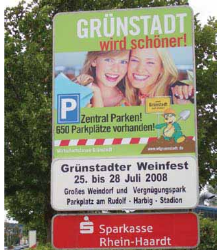
Informationsschild am Ortseingang, Grünstadt