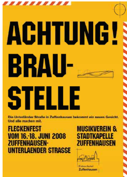
Plakat und Anzeige zum Zuffenhäuser Fleckenfest Grafik: EZZ

proaktiv begleitet und Konzepte erarbeitet und umgesetzt werden, die das geschäftliche Umfeld langfristig stärken.