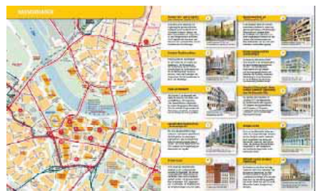
Dritter Baustellen-City-Guide des City Managements Dresden e.V. Quelle: www.cm-dresden.de, Oktober 2010