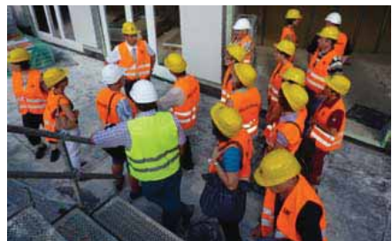
Baustellenführung durch Beschäftigte der Grundstücks- und Wohnungsbaugesellschaft Schwäbisch Hall mbH

Maßnahmen, wie ein Bauzeitenplan auf der städtischen Homepage, eine Webcam, die jederzeit Einblicke in das Geschehen der Baustelle gibt, sowie eine vermehrte Öffentlichkeitsarbeit in Zusammenarbeit mit der örtlichen Presse gehören bereits zum Alltag. Vor-Ort-Baustelleninformationen an der VR Bank und am Badtörweg ermöglichen interessierten Passanten, sich die Baustelle anzuschauen und sich über das geplante Projekt umfassend zu informieren.