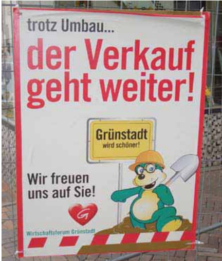
Bauzaun-Banner mit Maskottchen, Grünstadt