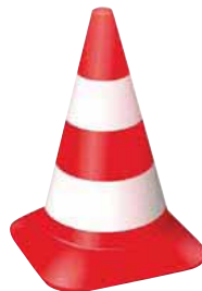
Baustellen-Logo der Stadt Heidelberg