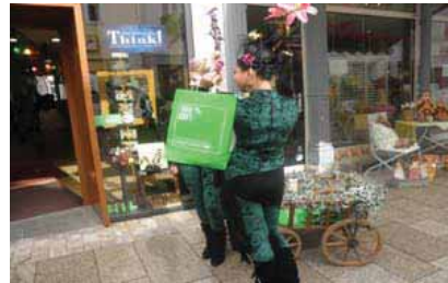
Frühlingsfest-Auftakt: OWIgut-grüne Feen verteilen Give-aways

Da das ‚Baustellenmarketing‘ der Stadt sich im Wesentlichen auf Hinweisschilder und Postkarten beschränkte, war man sich seitens OWIgut schnell bewusst, umfassendere eigene Aktivitäten zu entwickeln.