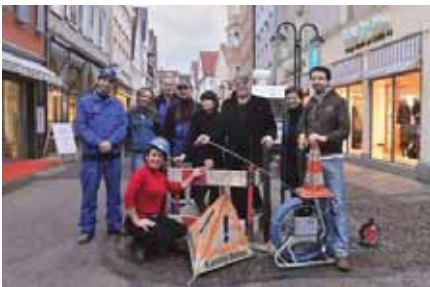
Baustelleneinrichtung mit OWIgut-Verantwortlichen

Als räumliches und funktionales Zentrum von Reutlingen ist die Altstadt wichtigster Baustein im Gesamtkatalog der Stadtentwicklung. Trotz der Durchführung mehrerer, kleinräumiger Sanierungsmaßnahmen ist sie in weiten Teilen nach wie vor in städtebaulich-gestalterischer wie in funktionaler Hinsicht erneuerungsbedürftig. Aus diesem Grund hat die Stadt in den Jahren 2005/2006 einen städtebaulichen Ideenwettbewerb „Neugestaltung der Straßen und Plätze in der Altstadt“ durchgeführt, in dem Leitideen eines Entwicklungskonzepts für die Altstadt erarbeitet wurden. Dieses Entwicklungskonzept verknüpft strukturell-funktionale und gestalterische Aspekte und war Ausgangspunkt für die Ausformulierung städtebaulicher Zielsetzungen im Altstadtrahmenplan. Im diesem Zuge wurde die städtebauliche Erneuerung in neun Bauabschnitte eingeteilt. Dabei sollen jeweils Bodenbeläge, das Beleuchtungskonzept und die Möblierung des öffentlichen Raums komplett neu gestaltet werden. Hinzu kam, dass die Stadtwerke „Fair Energie“ im Rahmen der Baumaßnahme alle unterirdischen Leitungen neu verlegen mussten. Dazu war ein Aufriss aller Straßenbereiche notwendig.