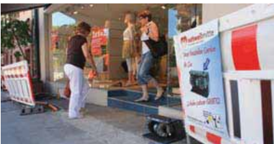
Ersatzleitungen wurden kundenfreundlich verlegt

Die Stadt Rottweil als auch das durchführende Energieversorgungsunternehmen ENRW legten bereits im Zuge der Neuverlegung der Gasleitungen viel Wert auf eine offene Kommunikation der Baumaßnahme gegenüber den Anliegern, Einzelhändlern sowie der Presse. Im Juli