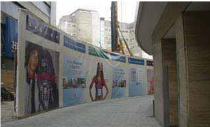
Bauzaun als Werbefläche, München Foto: CIMA GmbH, 2006