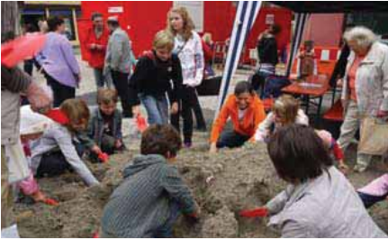
Marketing-Aktion des GHV auf der Baustelle

Um stets alle Bürger über die aktuellen Entwicklungen zu informieren, geben die städtische Pressestelle und die Marketingabteilung der ENRW in enger Zusammenarbeit regelmäßige Medieninformationen heraus. Zudem wurde auf der städtischen Homepage www.rottweil.de eigens eine neue Rubrik „Rottweil-Mitte“ eingerichtet. Hier finden Anwohner, Gewerbetreibende, Erwerbstätige, Touristen und Kunden alle Informationen, um trotz der Baustelle ihren Alltag gut zu bewältigen. Das Angebot im Internet wurde ferner durch einen Info-Container auf dem Kapellenhof, mitten auf der Baustelle, ergänzt. Interessierte können dort die Planunterlagen einsehen und den Verlauf der Arbeiten verfolgen. Zudem sind dort alle Informationen zur geänderten Verkehrsregelung sowie die geänderten Fahrzeiten und Fahrtrouten der Stadtbushlinie erhältlich.