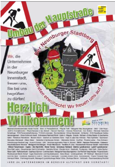
Baustellenfahrt, Neunburg vorm Wald