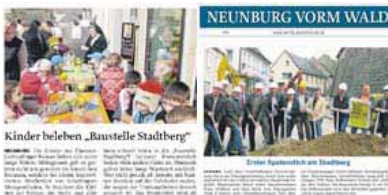
Presseberichte, Neunburg vorm Wald