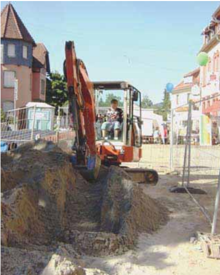
Kinderbaustelle bei einem Baustellenfest

und in Zusammenarbeit mit den betroffenen Gewerbetreibenden umgesetzt. Hierzu gehören neben der Verteilung von Infoblättern, die Schaffung von Kurzzeitparkplätzen, Erstellung von Merchandising-Produkten oder die Ausschilderung von Geschäften in Baustellenbereichen Veröffentlichung von Sonderbeilagen in der lokalen Zeitung sowie weitere situationsbedingte Maßnahmen im Sinne der Gewerbetreibenden. Während der Bauzeit und zum Ende der Baumaßnahme werden Feste im Baustellenbereich organisiert, bei denen sich die betroffenen Betriebe präsentieren können. Die gemeinsam am Runden Tisch konzipierten Marketingmaßnahmen tragen dazu bei, dass die Betriebe sich mit der Baumaßnahme identifizieren vor Ort ein „Wir-Gefühl“ entsteht und Kundenfrequenz aufrechterhalten wird. Der Erfolg zeigt sich daran, dass oft noch lange nach Beendigung einer Baumaßnahme gemeinsame Treffen und Aktionen durchgeführt werden.