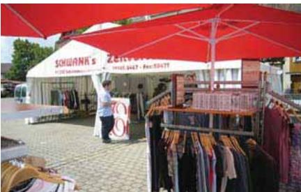
Ersatzverkauf in Zelten auf dem Paradeplatz während der Bauphase, Forchheim