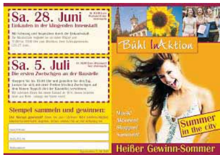
Flyer „Heißer Gewinn-Sommer“