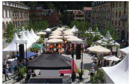
Einweihungsfeier Friedrich-Ebert-Platz Juli 2010

Mittel aus dem Unterstützungsfonds können Betriebe erhalten, deren wirtschaftliche Situation durch die Baumaßnahme nachweisbar Existenz bedrohend beeinträchtigt ist, denen jedoch kein Rechtsanspruch auf Entschädigung zusteht. Die Unterstützung aus dem Fonds ist eine freiwillige Leistung, über die ein unabhängiger Beirat entscheidet. Er setzt sich aus drei Personen zusammen, die ihr Fachwissen aus den Bereichen Recht, Immobilienwirtschaft, Finanz- und Steuerrecht einbringen. Die Beiratsmitglieder werden durch den Oberbürgermeister ernannt.