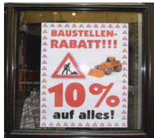
Baustellen-Rabatt, Weilheim Foto: CIMA GmbH, 2007