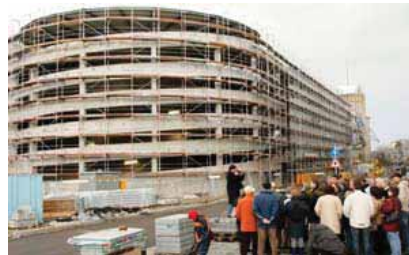
Baustellenfahrten und -führungen für die interessierte Bevölkerung sowie für Touristen, Essen