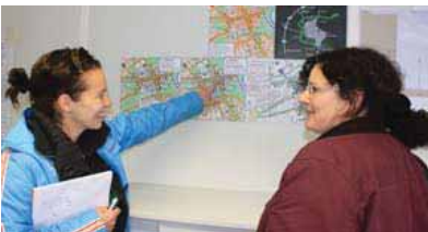
Im Info-Center der Baustelle

Um stets alle Bürger über die aktuellen Entwicklungen zu informieren, geben die städtische Pressestelle und die Marketingabteilung der ENRW in enger Zusammenarbeit regelmäßige Medieninformationen heraus. Zudem wurde auf der städtischen Homepage www.rottweil.de eigens eine neue Rubrik „Rottweil-Mitte“ eingerichtet. Hier finden Anwohner, Gewerbetreibende, Erwerbstätige, Touristen und Kunden alle Informationen, um trotz der Baustelle ihren Alltag gut zu bewältigen. Das Angebot im Internet wurde ferner durch einen Info-Container auf dem Kapellenhof, mitten auf der Baustelle, ergänzt. Interessierte können dort die Planunterlagen einsehen und den Verlauf der Arbeiten verfolgen. Zudem sind dort alle Informationen zur geänderten Verkehrsregelung sowie die geänderten Fahrzeiten und Fahrtrouten der Stadtbushlinie erhältlich.