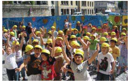
Galerie auf Zeit in der Baubude (oben) und Bauzaugestaltung durch Schüler (unten), Coburg