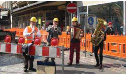
Baustellen-Musikanten, Fürth