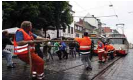
Masken- und Figurentheater (oben), Fotomontage mit Posterdruck (Mitte) und Straßenbahn-Pulling (unten), Bremen