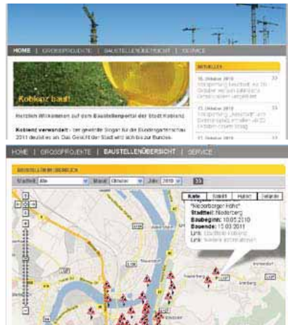
Internetplattform und dezentrale, ämterübergreifende Baustellendatenbank mit Informationen zu jeder Baustelle, Koblenz