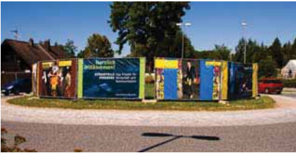
Vernissage (oben) und Bauzaun-Gestaltung am Kreisel (unten) durch Fotoprojekt „Erlebnis Beruf“, Penzberg