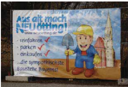
Bauzaun-Banner mit Maskottchen, Neuötting Quelle: Gewerbeverband Neuötting, 2006