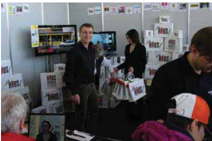
„Habs“-Tragetaschen als Eye catcher

Zahlreiche Events und Baustellenaktionen trugen dazu bei, die unvermeidlichen Belästigungen durch Verkehrsbehinderungen, Staub und Lärm erträglicher zu machen und die Motivation der betroffenen Gewerbetreibenden, am „Ball zu bleiben“, deutlich zu erhöhen. Diese Maßnahmen wurden je zur Hälfte von der Stadt Freiburg einerseits sowie durch die Interessengemeinschaft und Sponsoren andererseits finanziert.