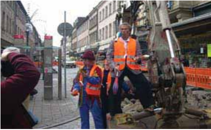
Baustellen-Gaukler, Fürth