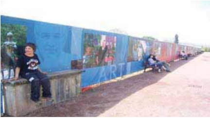
Bauzaugestaltung durch Imageposter der Stadt, Metz