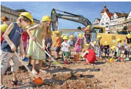
Symbolträchtiger „Spatenstich“ durch Kinder am 28. Juli 2008 – Ausdruck der engen Beziehung zwischen Tradition und Zukunft im Kocherquartier

Seit 160 Jahren prägt das im Volksmund „Kocherhotel“ genannte Gefängnis am Froschgraben das Stadtbild von Schwäbisch Hall. Mit der derzeit laufenden vollständigen städtebaulichen Umstrukturierung des Kocherquartiers geht eine mehrere Jahrzehnte dauernde Phase der planerischen und finanziellen Unsicherheit zu Ende. Zudem besteht die Chance, in unmittelbarer Anbindung an die historische Innenstadt von Schwäbisch Hall wichtige Ergänzungsfunktionen zur Stärkung des Stadtzentrums anzusiedeln. So sind eine Reihe von Fachmärkten, eine Bank, Dienstleistungseinrichtungen und Stadtwohnungen vorgesehen. Angesichts der wichtigen Rolle, die das Gefängnis für die Geschichte Schwäbisch Halls im 19. und 20. Jahrhundert gespielt hat, kann nur begrüßt werden, dass der denkmalgeschützte Ursprungsbau in neuer Funktion weitgehend erhalten bleibt.