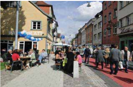
Eröffnungsfest: Bei strahlendem Sonnenschein strömten die Besucher in die umgestaltete Obere Breite Straße