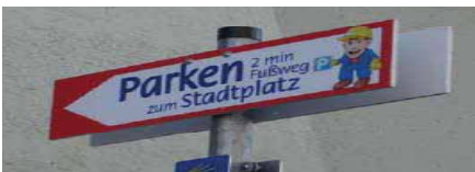
Ausschilderung Ersatzparkplatz (oben) und Baustellenkantine (unten), Neuötting