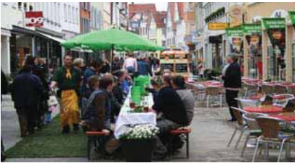
Vesper mit Bauarbeitern

Unter dem Kürbis-Symbol wurde zum großen Herbstfest in die fertig gestellte obere Wilhelmstraße eingeladen: Kürbis in allen essbaren Varianten und zum Schnitzen für Kinder. Grüne Tüten in einer zweiten Auflage beherrschten das Straßenbild.