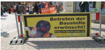
Baustellen-Banner mit Maskottchen, Fürth