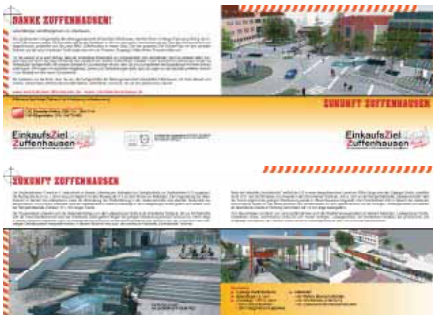
Infobroschüre der Aktionsgemeinschaft Einkaufszentrum Zuffenhausen; Grafik: EZZ

Die Bautätigkeit vollzieht sich seit Sommer 2008 und wird bis Ende 2011 reichen. Die Haupteinkaufsstraßen werden hierzu abschnittsweise aufgerissen, mit grobem Gerät bearbeitet und so in ihrer Verkehrs- und Parkierungsleistung stark eingeschränkt.