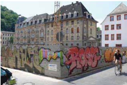
Gestalteter Bauzaun mit Graffiti und Schaulöchern

Um die negativen Auswirkungen von großen und längerfristigen Baumaßnahmen für Gewerbebetriebe im Baustellenbereich abzumildern und Härten auszugleichen, richteten die Stadt Heidelberg, die Stadtwerke Heidelberg GmbH und die Heidelberger Straßen- und Bergbahn GmbH im Jahr 2002 einen gemeinsamen Unterstützungsfonds ein, aus dessen Mitteln Bau begleitende Marketingmaßnahmen zugunsten der Gewerbetreibenden im Baustellenbereich finanziert sowie finanzielle Unterstützungsleistungen im Einzelfall gewährt werden können. Mit der Einrichtung des „Fonds für freiwillige Unterstützungsleistungen bei großen Tiefbauarbeiten“, kurz Baustellenunterstützungsfonds, entsprach die Stadt einem Wunsch des Heidelberger Gemeinderates. Die beteiligten Partner stellen jährlich ein Budget von 100.000 € für den Fonds zur Verfügung. Je nach Art der Baumaßnahme werden die Kosten anteilig zwischen Stadt und Stadtwerken aufgeteilt.