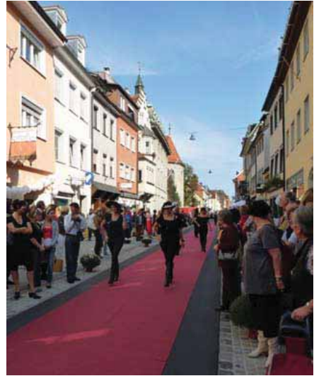
Laufsteg: Ein roter Teppich zum Eröffnungsfest

die aus Verantwortlichen der „Initiative Ravensburg“, der Verwaltung, der Bauleitung sowie der Anrainer bestand, beschlossen und realisiert.