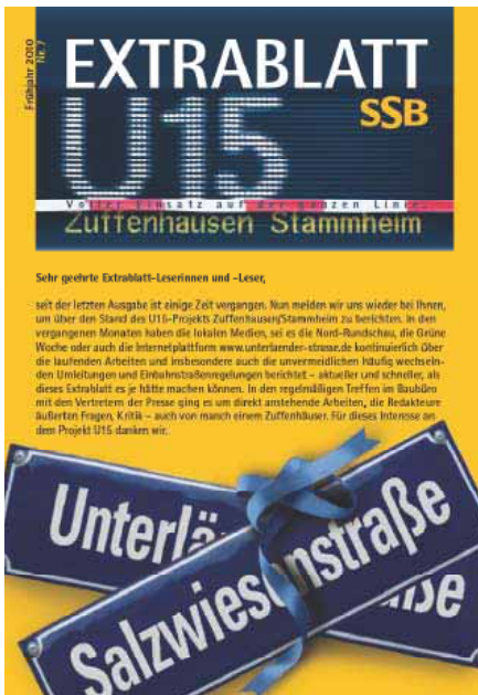
Informationsschrift der Stuttgarter Straßenbahnen AG