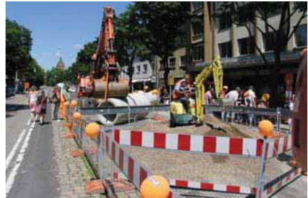
Zwei Jahre Umbau von „Hauskante zu Hauskante“

Inhaltliche Grundlage für das Marketing-Konzept, das von der Stadt Freiburg finanziert wurde, war eine Befragung aller betroffenen Gewerbetreibenden entlang der Habsburgerstraße über die bevorstehenden Baumaßnahmen. Darin wurden die Unternehmen nicht nur zu ihrer Stimmungslage zur Baustelle befragt, sie konnten auch konkrete Vorschläge zu einer möglichst reibungslosen Abwicklung machen und ihre Erwartungen an die Stadt, die Verkehrsbetriebe sowie die Bauleitung formulieren.