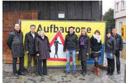
Präsentation des Werbebanners "Aufbauzone" durch Mitglieder der Initiative Ravensburg anlässlich des Beginns der Bauarbeiten