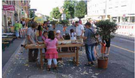
Kinderaktion beim Sommerfest 2009