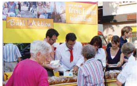
Aktion „Freie Fahrt in unserer Innenstadt“

Wichtig für den reibungslosen Ablauf war, dass die Anlieger direkt auf diese Personen zugehen konnten und kleine Probleme oftmals auch mit den Verantwortlichen auf der Baustelle direkt geregelt werden konnten. Ein weiterer Vorteil bestand darin, dass für die Durchführung aller Bauabschnitte Firmen aus der unmittelbaren Umgebung beauftragt wurden. Dieser „kurze Draht“ unter den Akteuren schaffte ein hohes Maß an gegenseitigem Verständnis und Bemühen, Unannehmlichkeiten so weit wie möglich zu vermeiden.