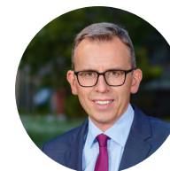
Sven Hinterseh Landrat Schwarzwald-Baar-Kreis